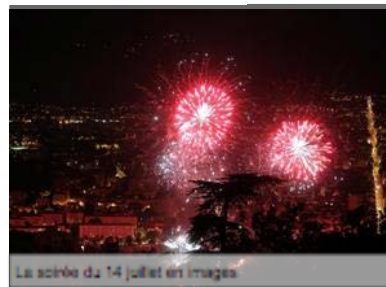
La soirée du 14 juillet en images