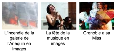
L'incendie de la galerie de l'Arlequin en images